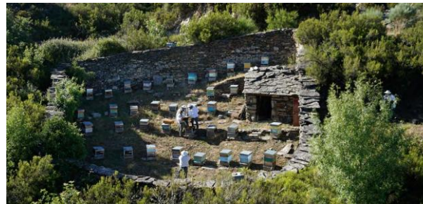
Colmenar objeto de estudio en Galicia

Más información en la web del proyecto www.varroaform.es