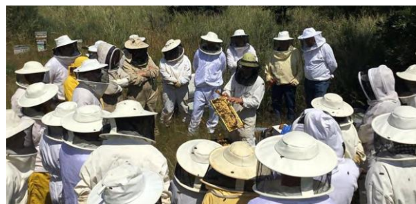
Colmenar objeto de estudio en Castilla y León

FEUGA es la entidad responsable del contenido del presente tríptico