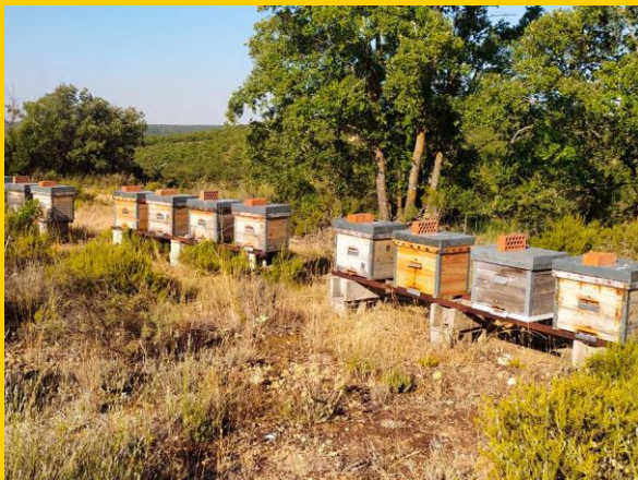
Colmenar objeto de estudio en Castilla-La Mancha

Para ello: i) se evaluará la eficacia y posible toxicidad en las abejas de los nuevos productos, ii) existe también un objetivo medioambiental y sanitario, ya que se persigue la reducción o ausencia total de residuos en la miel natural y otros productos derivados de la colmena (cera, propóleo), lo que también será evaluado, iii) se pretende además abaratar los costes que supone para los apicultores y productores los tratamientos actuales frente a la varroa, asociados, en parte, a la frecuencia en aplicación.